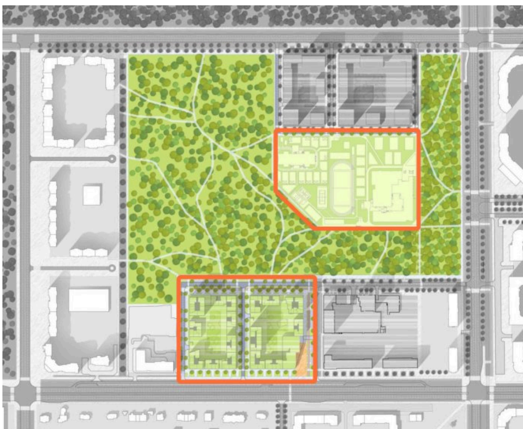
План застройки территории Березовой рощи (новая застройка выделена оранжевым цветом)

Новая волна протестов началась после того, как в начале мая глава города Алексей Орлов подписал постановление об утверждении проекта планировки территории, по которому должны вырубить около 40% рощи под жилую и общественно-деловую застройку «Атомстройкомплекса».