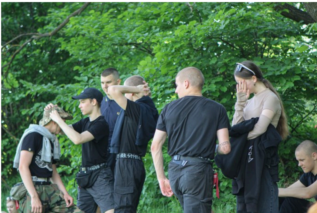
Молодые люди в черной одежде с неонацистской символикой неподалеку от места проведения «Хиппятника» в парке Царицыно, 1 июня 2024 год

«Пока вы деградируете по хиппи-фестивалям, мы совершенствуемся, как физически, так и духовно. Несколько „поздняковцев“ заставили дрожать всех этих собравшихся бездельников. Это показывает, насколько мы сильны», — заявила девушка комментаторам, осудившим ее за распыление перцового баллончика в парке.