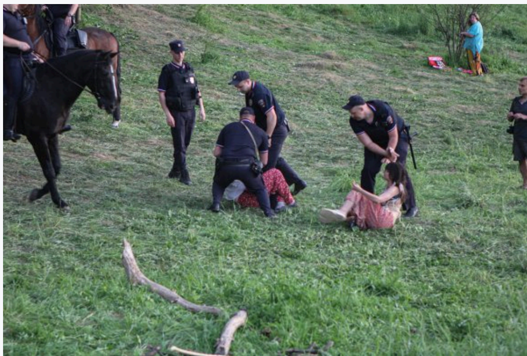
Задержание участников «Хиппятника» в парке Царицыно, 1 июня 2024 год

Именно в этот момент на поляне появилась конная полиция, которая объявила по громкоговорителю, что «Хиппятник» является «несогласованной акцией». Хиппи стали уходить, стараясь избежать взаимодействия с полицейскими.