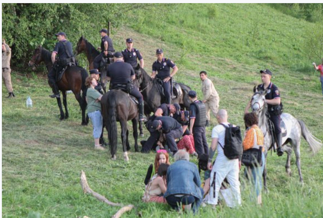
Задержание участников «Хиппятника» в парке Царицыно, 1 июня 2024 год