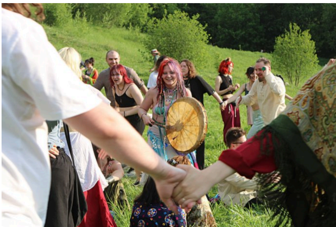
«Хиппятник» в парке Царицыно, 1 июня 2024 года

инструментах — флейте, аккордеоне и губных гармошках; танцевали и устраивали костюмированные фотосессии. На снимках участники «Хиппятника» с длинными косичками, необычным тематическим макияжем и в традиционной для хиппи яркой свободной одежде. В парке присутствовали и подростки, увлекающиеся косплеем.