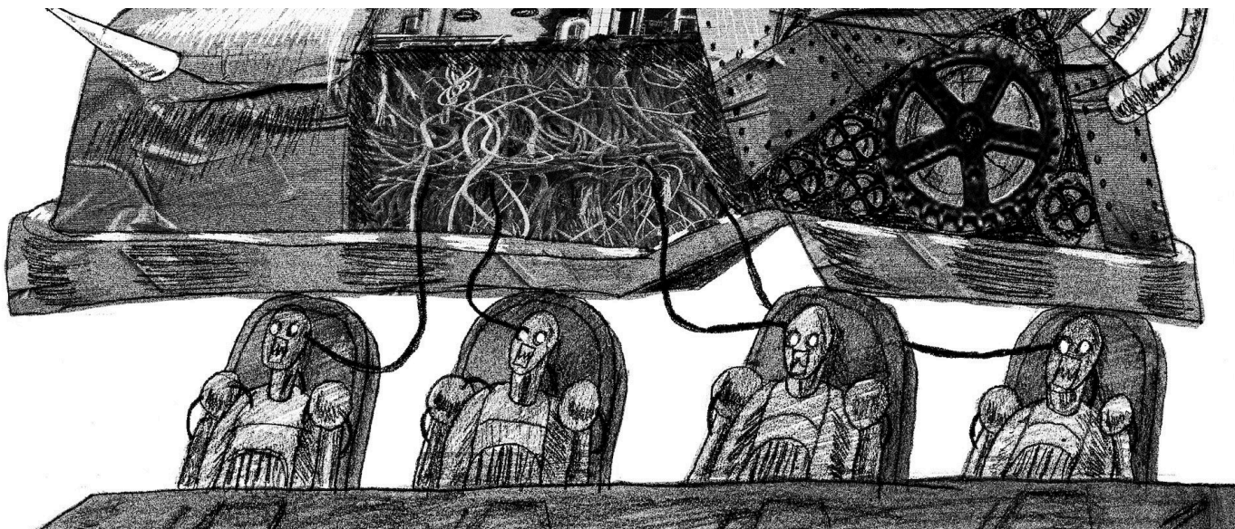
Иллюстрация: Майкл Скарн