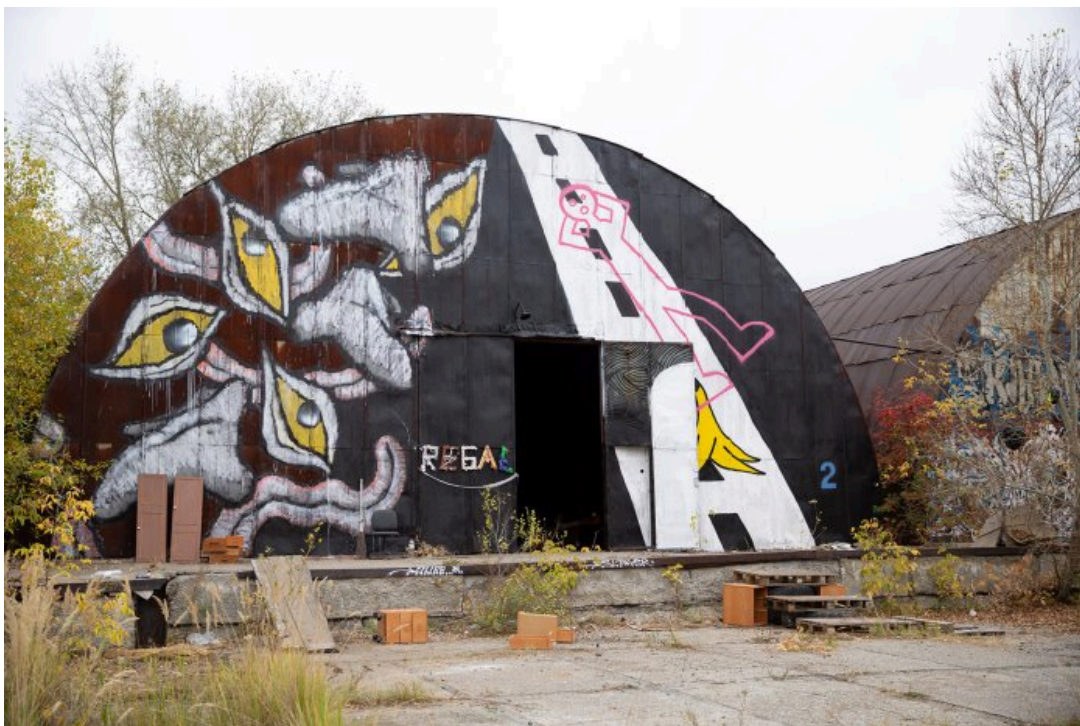
Ангар, в котором проходила выставка «Энтропия», 21 сентября 2024 года

«Место находится рядом с тем, где проходила предыдущая „Заброшка“, — продолжает он. — Художники не любят однообразие, люди хотели новое место. [В этот раз] у полиции был посыл, что тут опасный район, бывают наркоманы и драки, но две предыдущие „Заброшки“ прошли без проблем. Хотя первая была локальная и малюсенькая, ее и заметить сложно было, а вторая уже была здоровая и буквально в том же пространстве, просто через лесок».