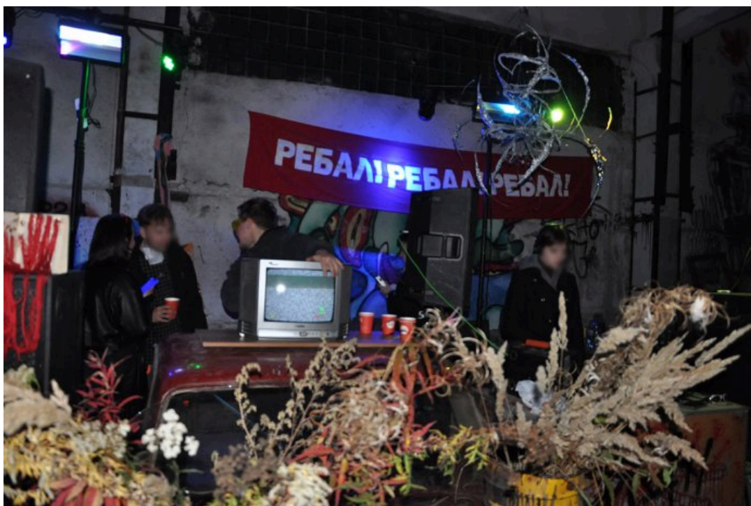
Вечеринка сообщества Ребал, 21 сентября 2024 года

Корреспондентка ОВД-Инфо обратилась за комментарием к сообществу Ребал, но участники команды отказались говорить, сославшись на анонимный концепт мероприятия. Позднее на связь с ОВД-Инфо вышел человек, назвавшийся пресс-секретарем Ребал, который согласился рассказать о том, что случилось на вечеринке тем вечером, не называя своего имени — «из соображений личной безопасности»: