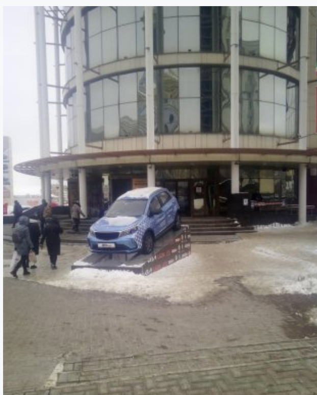
ТЦ «Огарев Plaza», к которому Сергей вышел с одиночным пикетом