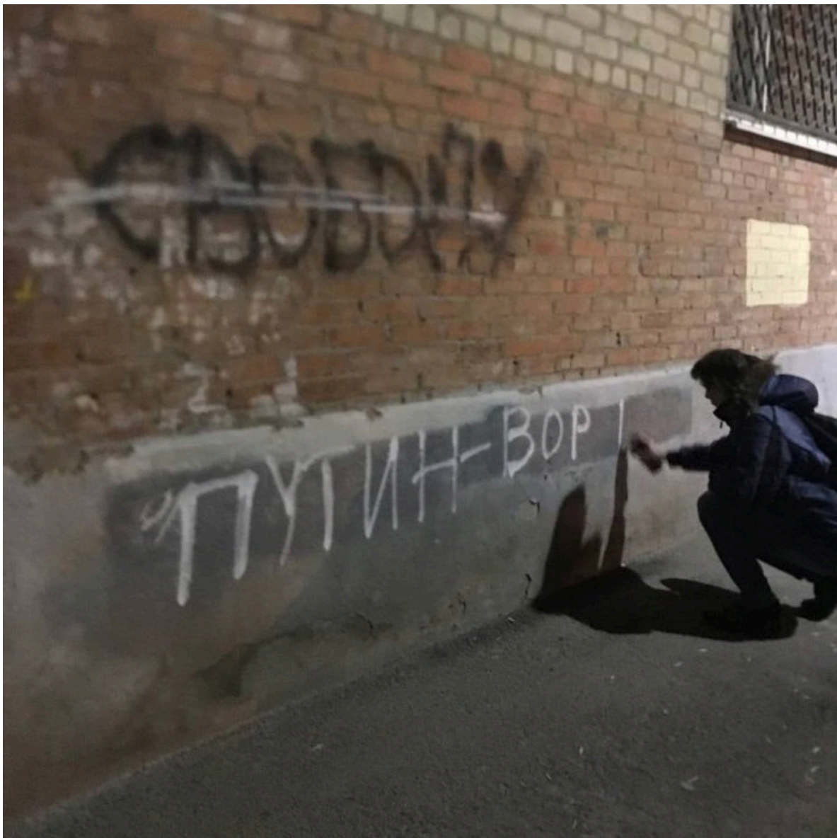
Фото граффити, сделанное Вероникой Горецкой