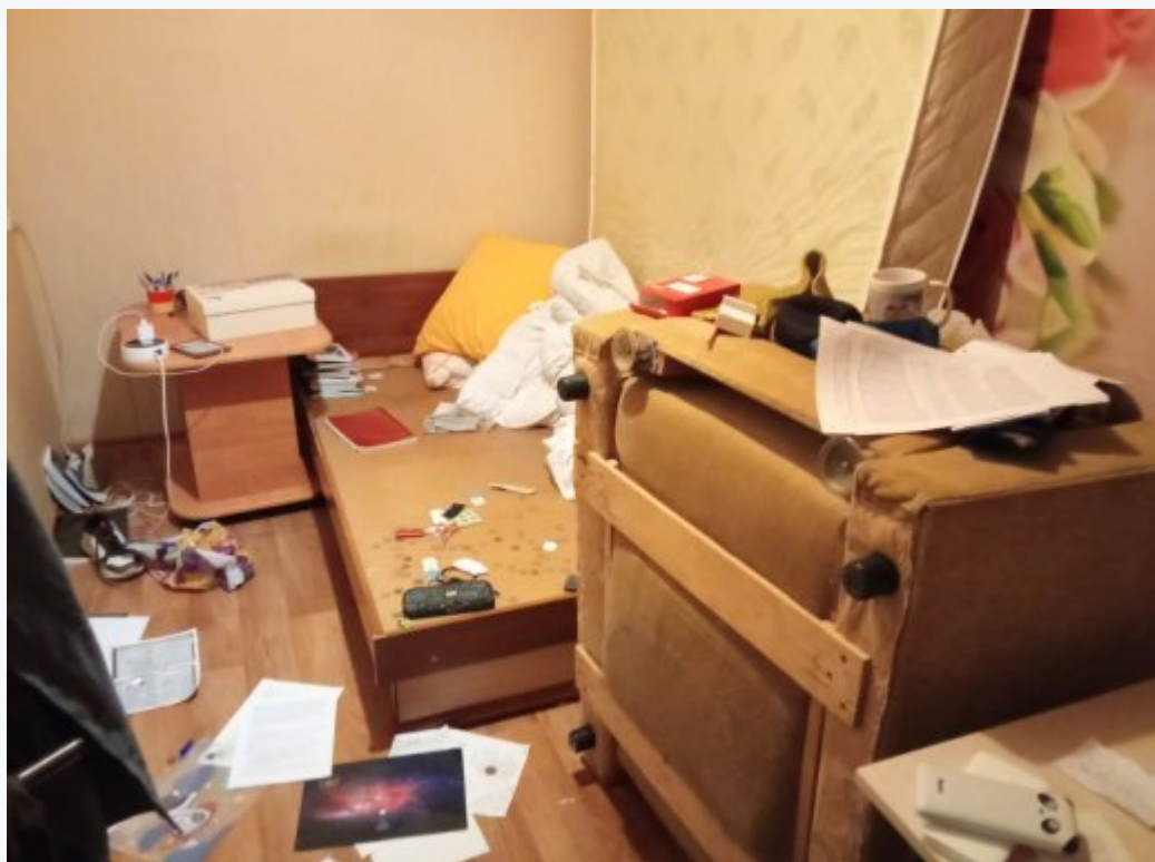
Квартира Надежды Беловой после обыска