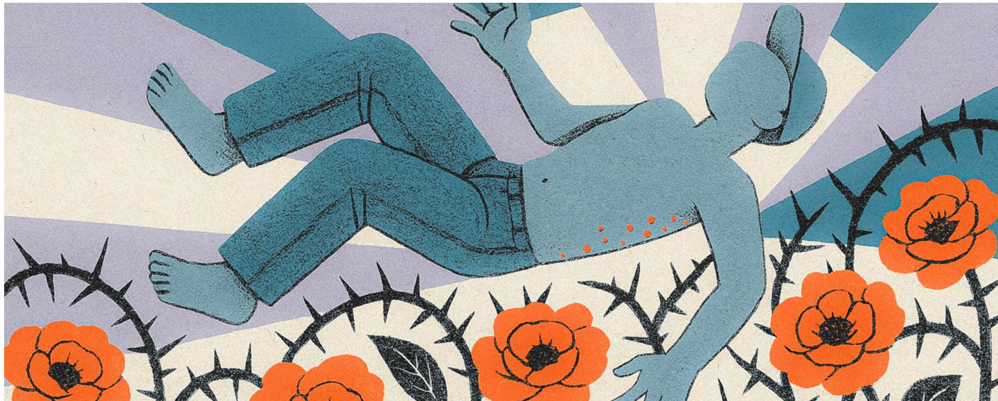
Иллюстрация: ОВД-Инфо, с использованием нейросетей