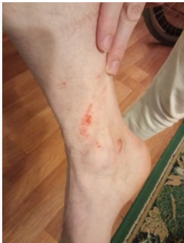
2) Следы побоев на теле мужа Надежды Беловой