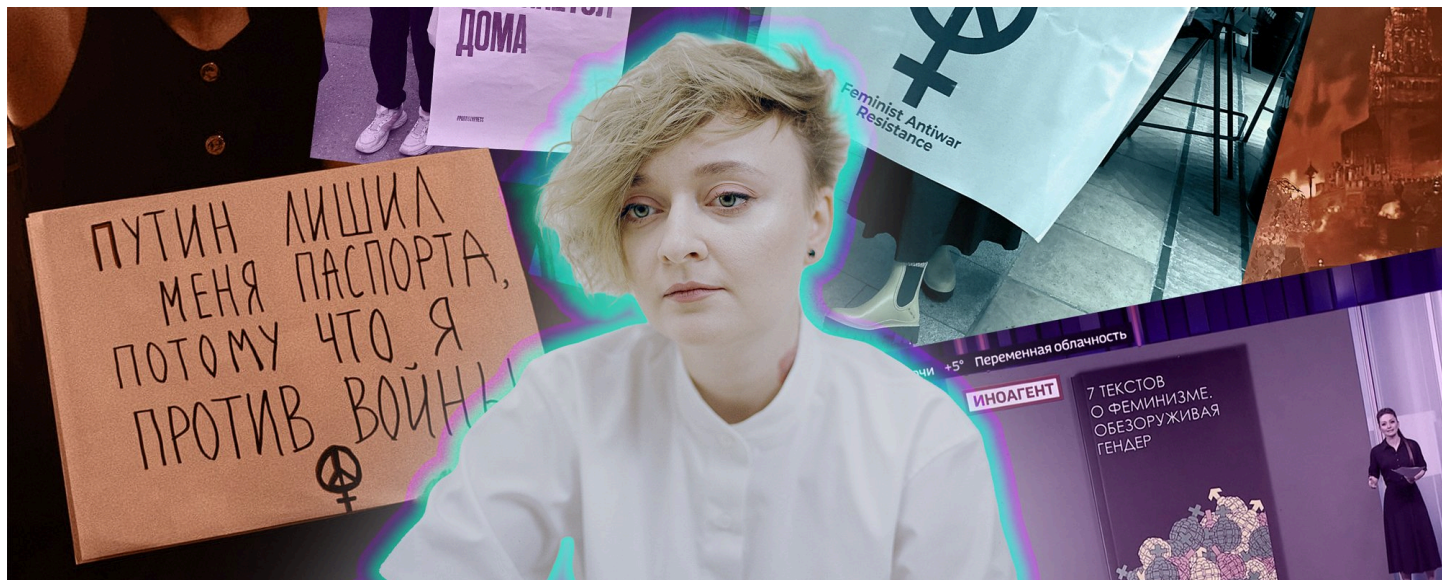
Фото: Wonderzine, соцсети Дарьи Серенко, «Россия 24» / Коллаж: ОВД-Инфо