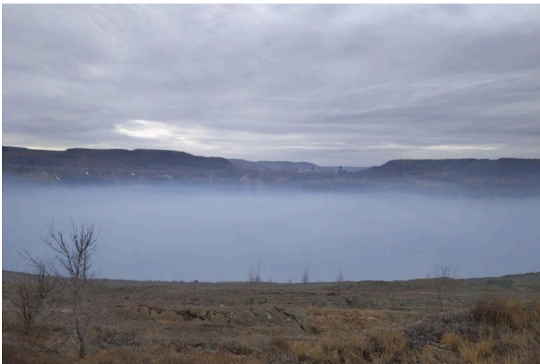
Дым от горения серы в сибайском карьере, ноябрь 2018 года