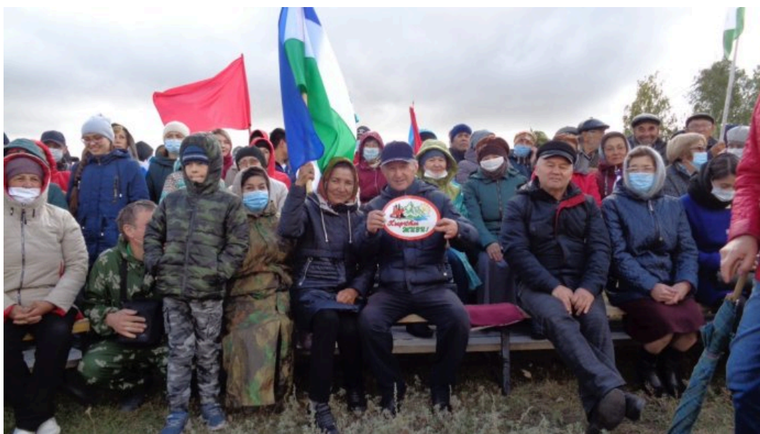
Участники народного схода в селе Аскарово, 20 сентября 2020 года

схода в защиту Кыркытау, в них участвовало до двух тысяч человек. На второй митинг пришли не только местные, но и жители других районов Башкортостана. Люди скандировали «Кыркты-тау йәшә!» . Местные СМИ писали , что полиция пыталась задержать активиста с флагом в поддержку Куштау, но быстро отпустила .